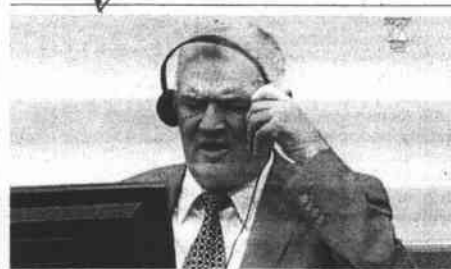
Mladic interrumpió a gritos la vista.

Un sondeo del instituto BVA publicado ayer da la clave de lo que intentan imponer los strausskahnianos: un 54% de los franceses no querría que Strauss-Kahn fuera candidato a las primarias socialistas, y un 63% estaría seguro de que, de todas formas, no puede regresar. El desenlace, como el de un buen culebrón, se espera para el final del verano. ■