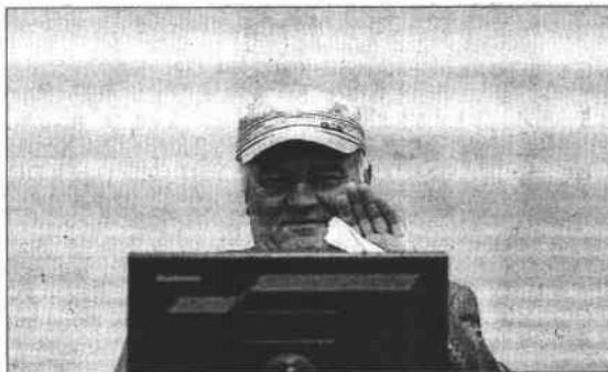
Ratko Mladic comparece ante el tribunal en La Haya.

"No, no, no. No pienso seguir aquí", dijo Mladic, levantándose. Sin más dilación, fue expulsado de la sala. El problema es saber qué pasará ahora, porque la sesión se levantó sin fecha concreta para su reanudación.