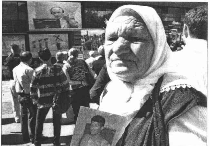
Familiares de las víctimas siguen el juicio de Mladic por pantalla gigante en la Plaza de los Niños en Sarajevo.

El circo del presunto criminal prosiguió con quejas sobre la traducción al serbio, protestas por no poder lucir la gorra militar que acostumbra y sucesivos desaires. Tanto que mientras el juez Orije enumeraba los cargos que se le imputan—entre los que figura el de genocidio—comenzó a interrumpirle y a tachar las acusaciones de «monstruosas» y «desagradables». «¿Quién eres tú? No eres