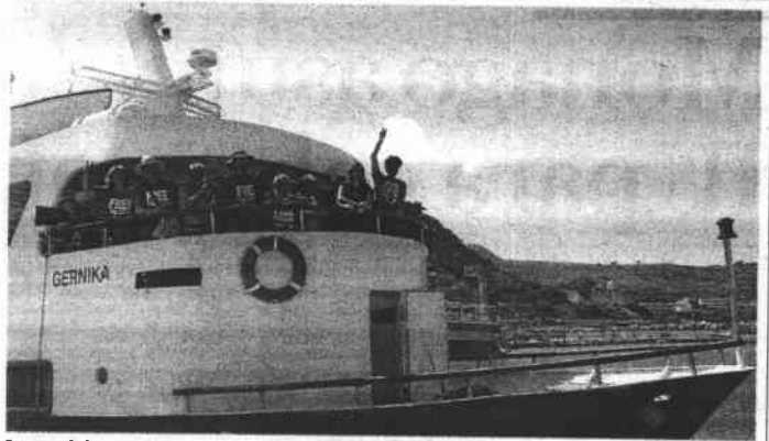
Los activistas protestan, ayer, a bordo del 'Gernika' en Creta. I.A.

Quienes sí las soltaron fueron los activistas canadienses que consiguieron hacerse a la mar, según explicaron en Twitter. A los pocos minutos de zarpar desde otro puerto de Creta, las autoridades griegas les interceptaron y les obligaron a regresar a puerto. ●