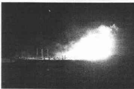
Un soldado camina frente a las llamas del gasoducto.

EL CAIRO // Una explosión incendió ayer en Egipto un gasoducto que suministra gas a Israel y Jordania. El sabotaje, que no ocasionó víctimas ni daños en los edificios cercanos, interrumpió el suministro a ambos países. Se trata de la tercera explosión intencionada de un gasoducto en Egipto desde febrero.