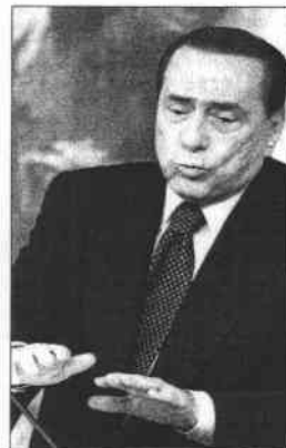
Silvio Berlusconi

«Sería la prueba de que las medidas de austeridad van a ser un problema para todos los italianos excepto para el primer ministro, para quien resultarían una solución», añadía en relación al paquete de medidas aprobado la semana pasada por el Consejo de Ministros para conseguir ahorrar 47.000 millones de euros en los próximos tres años y que ya ha sido enormemente criticado porque los recortes más duros (por valor de más de 20.000 millones de euros) tendrían lugar entre 2013 y 2014, es decir, una vez concluida la actual legislatura y cuando según todos los indicios Silvio Ber-