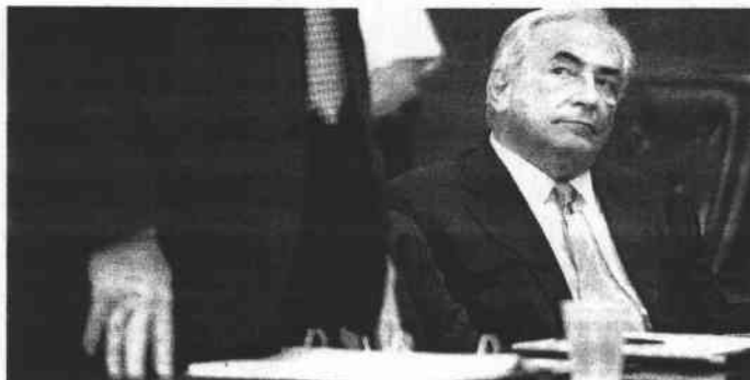
Strauss-Kahn durante la vista del pasado 1 de julio en Nueva York.

Ayer, varios medios franceses, daban por seguro que la Fiscalía neoyorquina "ha perdido su apuesta" de respaldar la denuncia presentada contra Strauss-Kahn por una mujer de la limpieza de un hotel de Nueva York, que lo acusa de agresión sexual. Aunque fuera así, algo que se verá el 18 de julio, lo que ya es seguro es que el viacrucis judicial