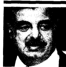
Rafiq al Hariri.

Por otro lado, la Federación de Sindicatos de Periodistas españoles FeSP exigió al Gobierno a través de un comunicado, que garantice la seguridad de los profesionales que se embarquen en la expedición. •