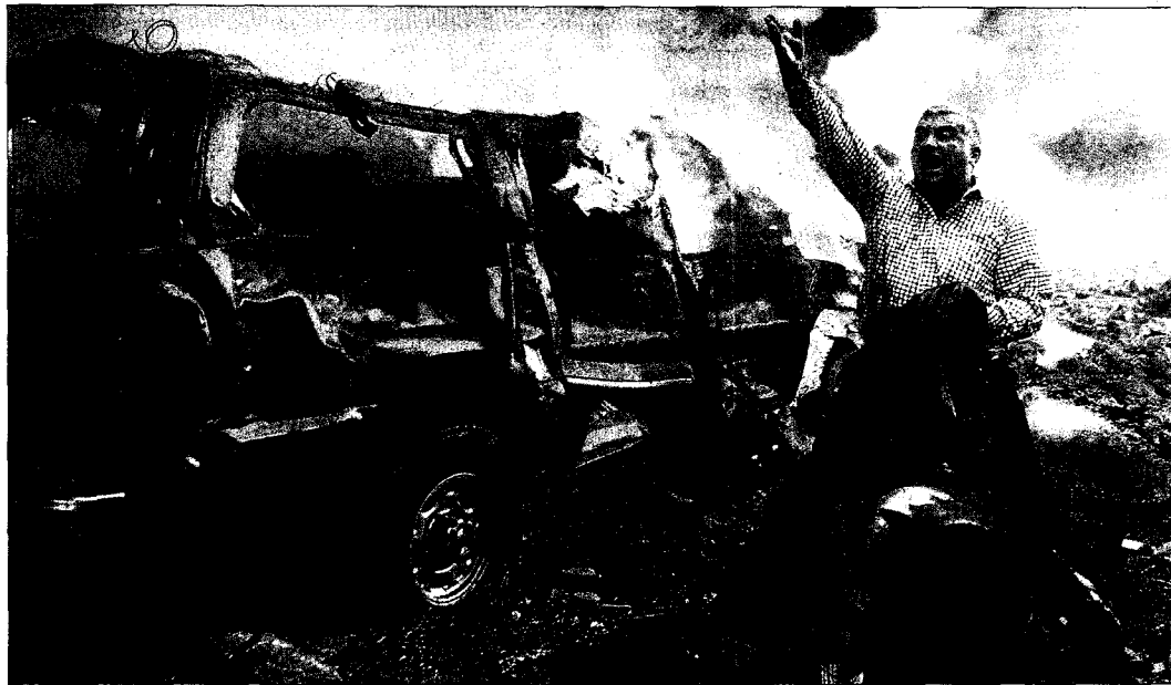
Un hombre pide ayuda tras la explosión del coche bomba que mató a Rafik Hariri el 14 de febrero de 2005 en Beirut.

como la de asesinar al primer ministro libanés sin consultar a sus patrones y financiadores, los Gobiernos de Siria e Irán.