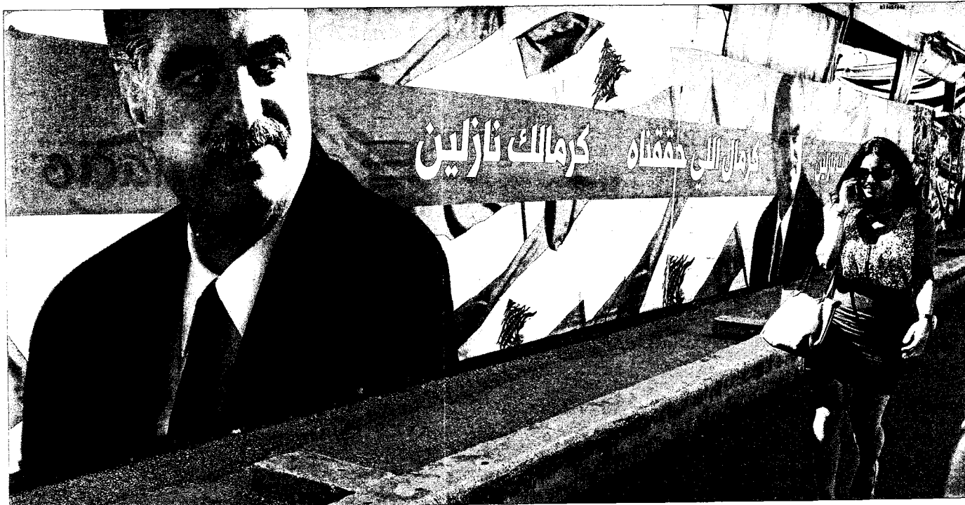
Una mujer pasa por delante de carteles que recuerdan al ex primer ministro Rafic Hariri, asesinado en 2005, cerca de su tumba en el centro de Beirut.

&gt; TENSION EN EL PAÍS DE LOS CEDROS / La acusación de la ONU