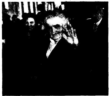
Mujica, en la cumbre del Mercosur en Asunción.