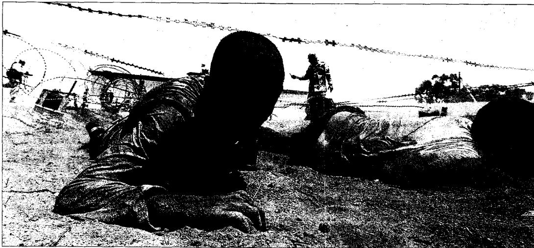
Soldados rebeldes demuestran sus habilidades durante su ceremonia de graduación, ayer en Bangasi.