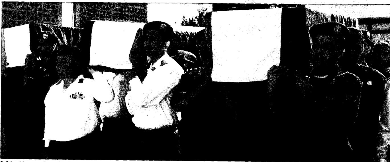
Policías sirios cargan los ataúdes de sus camaradas muertos en Jisr al Shugour, en la procesión funeraria de ayer desde el Hospital de la Policía en Damasco.