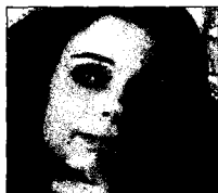
Amina Araf. / EL MUNDO

«Si queremos vivir en un país libre hay que empezar por vivir como si ya estuviésemos en un país libre». Así describía su filosofía Amina Araf Abdalá al Omani, la bloguera siria de apenas 35 años que ha cobrado fama al convertirse en una de las figuras más conocidas del movimiento opositor dentro del país. Abiertamente feminista y lesbiana, a la vez