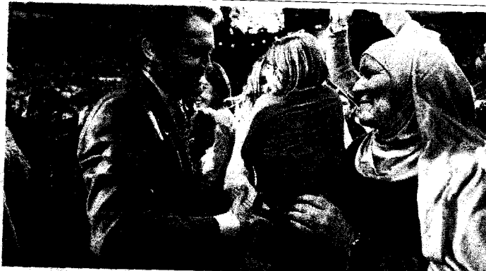
Artur Mas saluda a una mujer en un mitin en Barcelona. M. ANGELES TORRES

Europa Laica denuncia además que "una parte considerable de esos fondos económicos" dedicados a la próxima visita del papa en agosto saldrá del dinero público, "un hecho ya de por sí grave, pero que se agrava más en medio de la importante crisis económica, del desempleo y de los recortes de derechos sociales que estamos padeciendo".