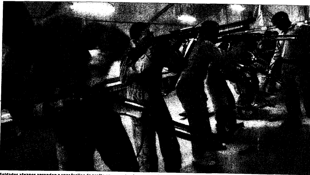
Soldados afganos aprenden a usar fusiles de asalto en un centro de entrenamiento para nuevos reclutas en Lashkar Gah (Helmand).