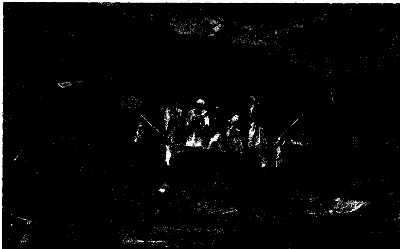
Miembros de la tribu yemení de Sadiq al Ahmar inspeccionan los daños tras un ataque en una casa de Saná.

Unos 4.000 manifestantes en Saná, que durante cinco meses han estado pidiendo la dimisión de Saleh, convocaron una marcha del millón para que el presidente se quede en Arabia Saudí. «El pueblo quiere formar un consejo de transición. No dormiremos, no nos