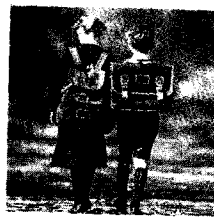
Niños de uniforme.