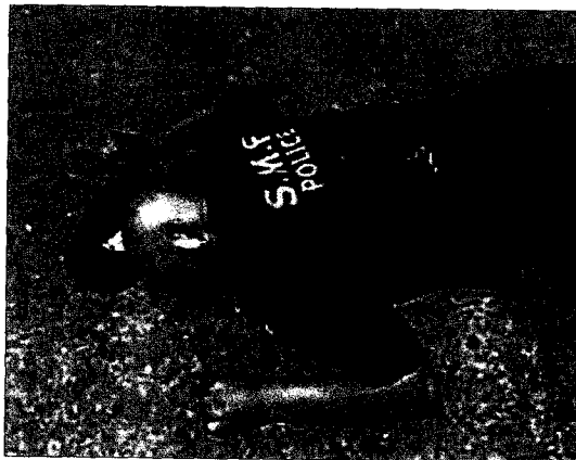
Un agente muerto de un disparo yace en Jisr al Shughour.

Es cuestión de tiempo que los civiles sirios se armen, como lo hicieron los libios. Y el grueso del ejército es suní, aunque sus mandos sean