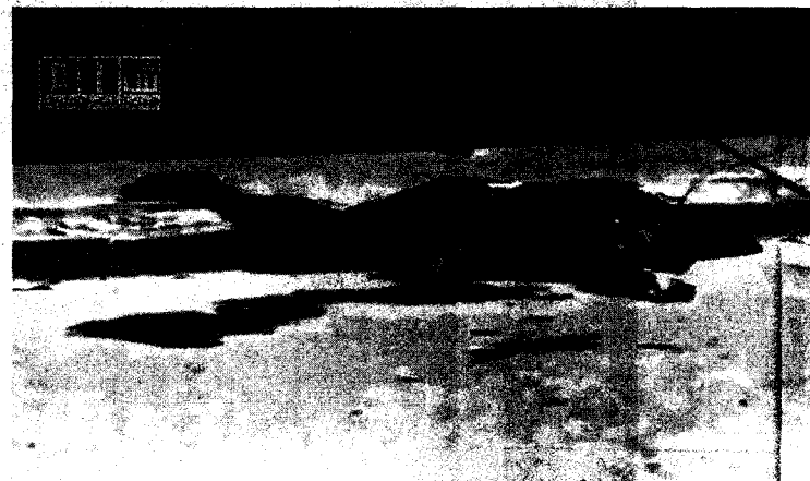
FRANCOTIRADORES ASESINOS Un hombre yace gravemente herido en una calle de Derá, en esta imagen de un videoaficionado del 24 de abril, después de recibir el disparo de un francotirador.

el 23 de abril que acabó con la vida de 34 personas. La organización cifra en 200 víctimas mortales el cerco de Derá por el Ejército el 25 de abril.