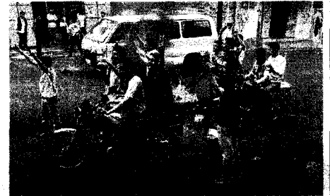
Manifestantes bloquean, ayer, una calle de Taiz.

Milicianos tribales se enfrentan toda la noche en la capital con las fuerzas del dictador Saleh