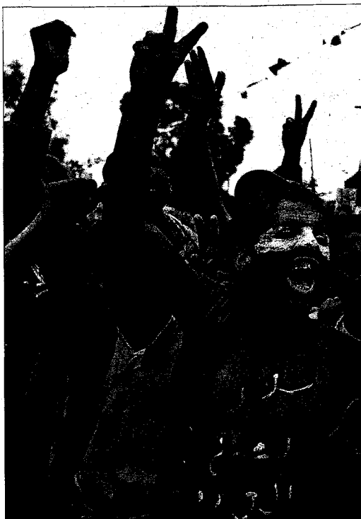
Manifestantes piden en Saná que Saleh deje el poder.

Después de cuatro meses de contestación popular, que Saleh ha reprimido a sangre y fuego, el conflicto dio un inesperado giro la semana pasada cuando las fuerzas leales al presidente y las del jeque Sadeq se enfrentaron a cañonazos en el barrio de Al Hasaba. Sadeq es el jefe de la confederación tribal Al Hashed, la ma-