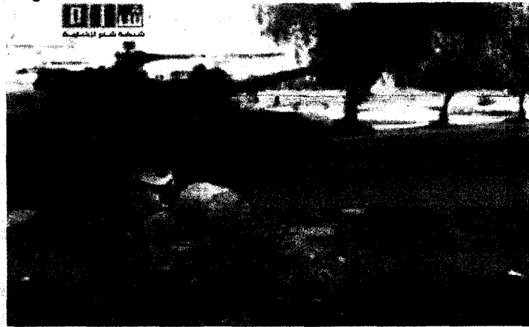
LOS TANQUES, EN LAS CALLES DE DERÁ Captura de un vídeo de Sham News Network difundido en una red social que muestra uno de los tanques que sirvieron para sitiar Derá, el pasado 26 de abril.

HRW menciona casos concretos, entre ellos un ataque a la mezquita Al Omari, punto de reunión de los manifestantes, en la que murieron más de 30 personas entre el 23 y el 25 de marzo, y otro asalto contra un funeral en Izza entre el 22 y