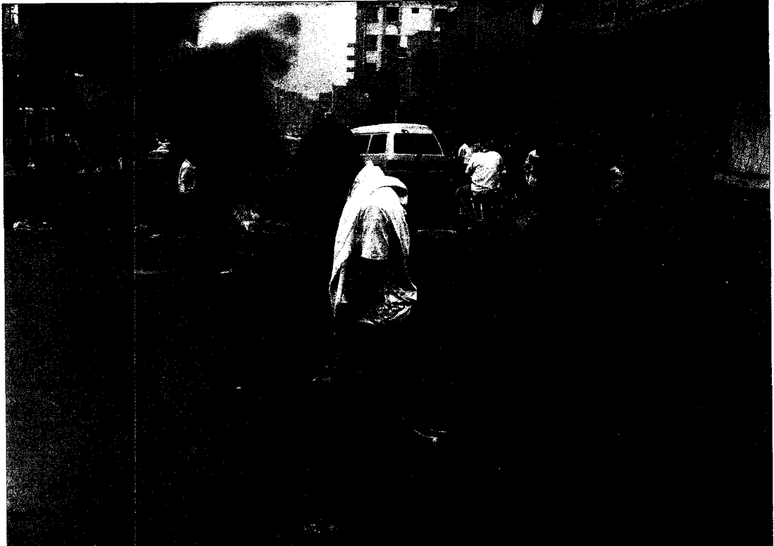
Varios activistas antigubernamentales yemeníes bloquean una calle durante una manifestación, ayer, en la ciudad de Taiz, al sur del país.

«Hasaba se ha convertido en una zona de guerra. El jefe Hashim [hermano de Sadiq al Ahmar] nos