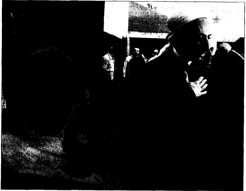
Opositores sirios reunidos en Turquía pasan junto a la imagen de una de las víctimas de la represión en Homs.

«El caso de Hamza es importante, pero lo más destacable es que hay cientos de víctimas invisibles de cuyo destino no conocemos», admite Houry. Las autoridades sirias —que ayer volvieron a negar que el niño fuese torturado— no permiten la en-