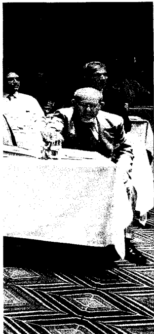
Miembros de la disidencia siria, reunidos en Antalya (Turquía), sentados junto a fotografías de manifestantes asesinados durante las protestas.