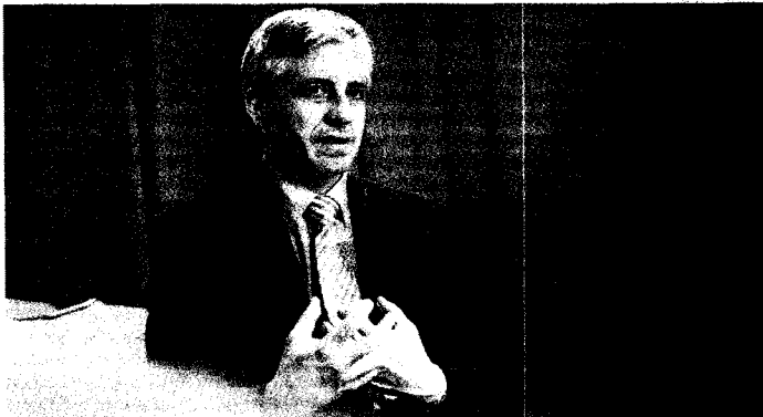
García Linera, durante su entrevista con 'Público' en Madrid.

Vicepresidente de Bolivia. El exguerrillero se ha convertido en el arquitecto jefe de las políticas del Gobierno de Evo Morales