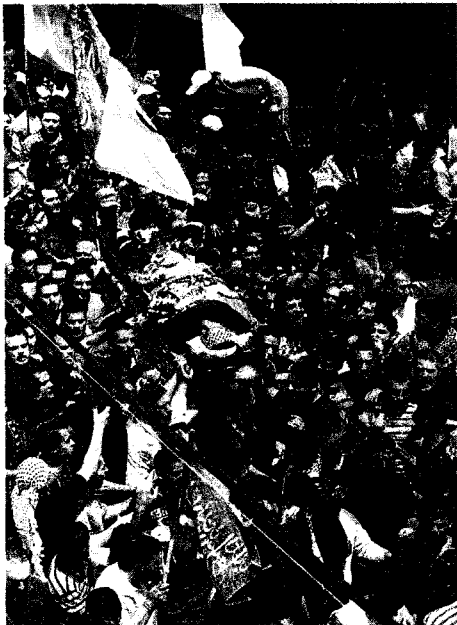
Funeral en un campo de refugiados libaneses. M. ZAVAT / AFP

En Damasco, las autoridades sirias cargaron contra Israel, aprovechando la ocasión que les brindaron unos incidentes