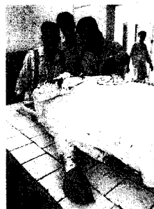
Una víctima, tras el ataque.

KARACHI // Un grupo de hombres armados atacaron ayer un coche del Consulado de Arabia Saudí en Karachi y un diplomático del país árabe resultó muerto. Los talibanes aseguraron que no saben si el autor del crimen es uno de ellos, aunque expresaron su apoyo al asesinato. No se reveló la identidad de la víctima.