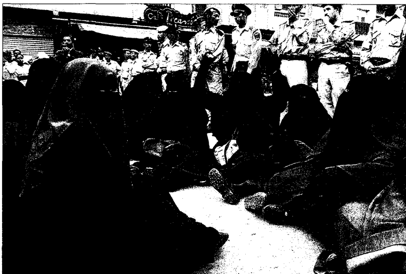
Mujeres familiares de los reos salafistas declarados en rebelión imploran clemencia a las autoridades.

Este salafista, que pasó cuatro años en los penales marroquíes, afirmó que hace dos meses el Estado se comprometió a liberar poco a poco a los salafistas detenidos tras la Ley Antiterrorista de 2003, criticada por organizaciones como Human Rights Watch por contravenir los protocolos internos marroquíes así como las