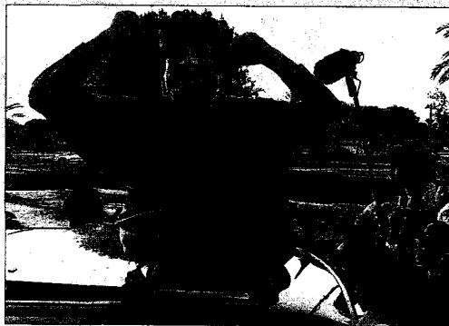
Gadafi saluda a sus partidarios en Trípoli el 10 de abril.

► Muamar el Gadafi. Líder de Libia desde el golpe de Estado de 1969, oficialmente no ocupa ningún cargo público y se le atribuye el título de Guía de la Revolución . Además de la represión de los opositores, se le acusa de haber apoyado el terrorismo internacional durante los años ochenta.