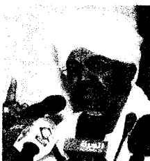
Omar al Bashir.

Creado por iniciativa de Naciones Unidas mediante el Tratado de Roma en 1998, el