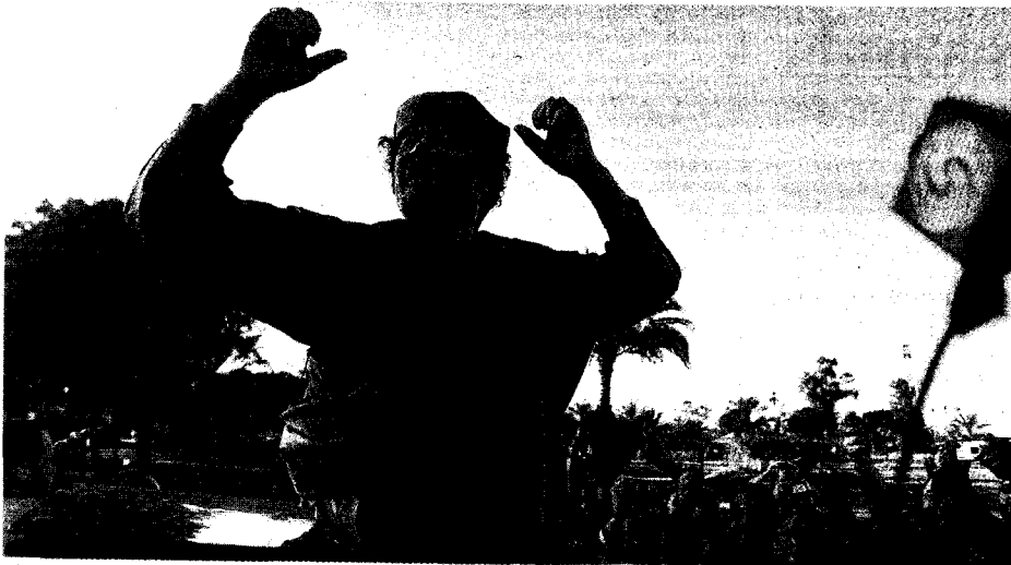
El líder libio saluda a sus seguidores en la explanada del complejo presidencial de Trípoli, el 10 de abril.