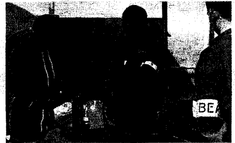
Agentes franceses muestran una de las cajas.

Los investigadores publicarán un primer informe sobre las causas de la tragedia este verano