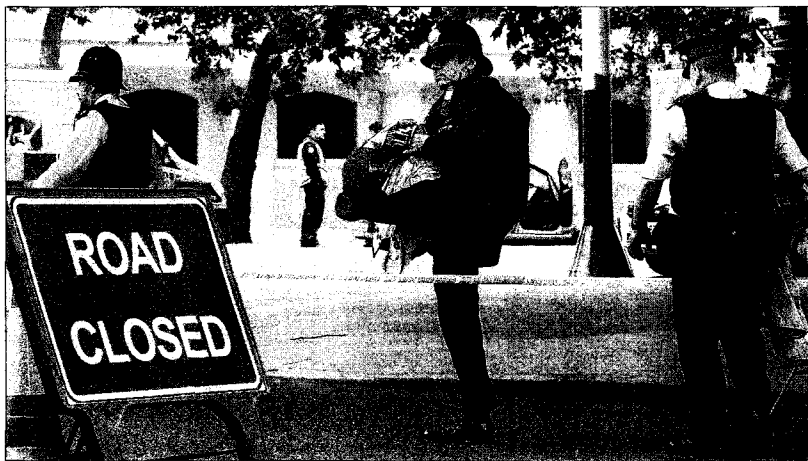
Un policía cruza el perímetro de seguridad en torno a una calle de Londres cerrada por amenaza de bomba.

Ayer la alerta se trasladó por unas horas al Reino Unido, donde una llamada anónima alertó de la colocación de un artefacto explosivo en las calles de Londres. Scotland Yard efectuó la explosión controlada de una maleta y examinó las alcantari-