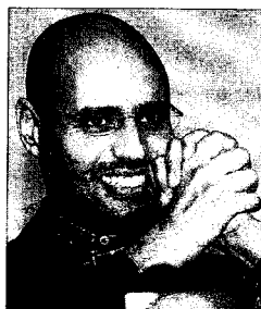
Saif el Islam.

► Abdulá Senusi. Cuñado de Gadafi y jefe del espionaje militar. Se le considera la mano