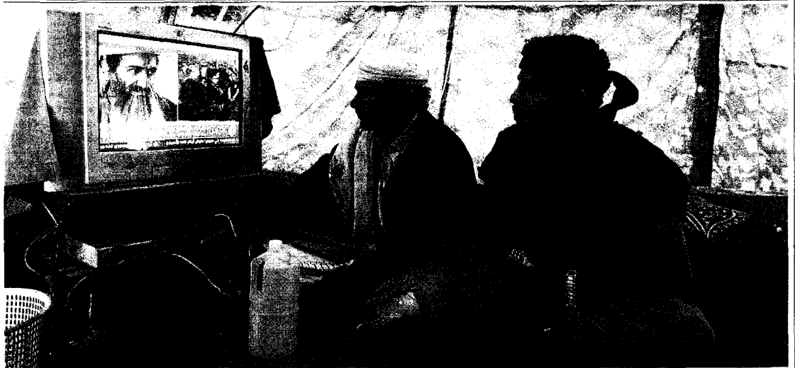
Un grupo de manifestantes opositores yemeníes ve la televisión en una tienda de campaña en Saná, Yemen, ayer.

Pero las enormes revoluciones en el mundo árabe de los últimos cuatro meses implican que Al Qaeda ya está políticamente muerta. Bin Laden ya le dijo al mundo —más concretamente, a mí, en persona— que quería destruir los regímenes prooccidentales del mundo árabe, las dictaduras de los Mubarak y los Ben Ali. Quería crear un nuevo Califato Islámico. Pero en los últimos meses, millones de árabes musulmanes se levantaron y se prepararon para su propio martirio